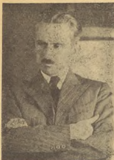
ДРУГ ПРЕДСЕДНИК ДИМИТРИЈЕ В. ЉОТИЋ